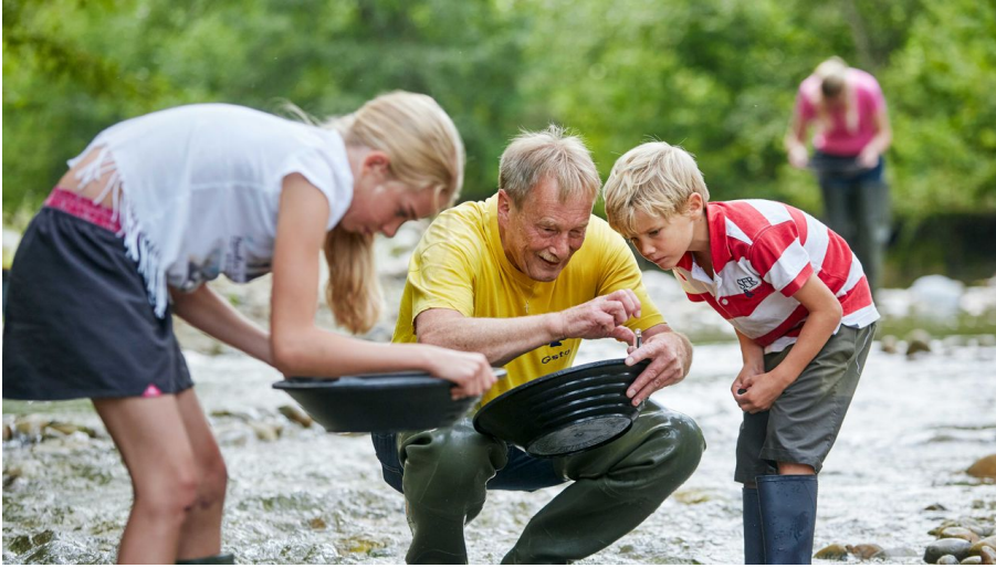
Goldwaschen im Napfgebiet