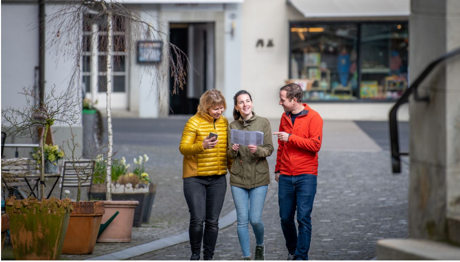
Krimi-Trail Willisau