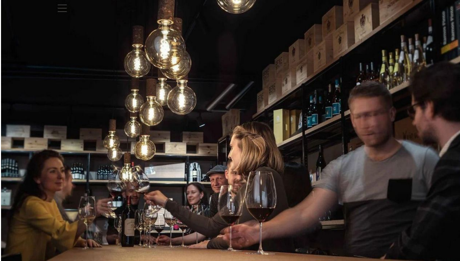
Vinothek Hauser