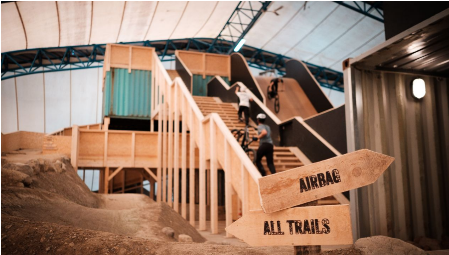
Wheel Park Airbag or Trail