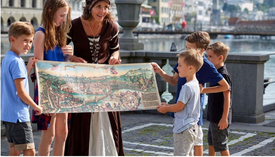
Erlebnisführung für Kinder