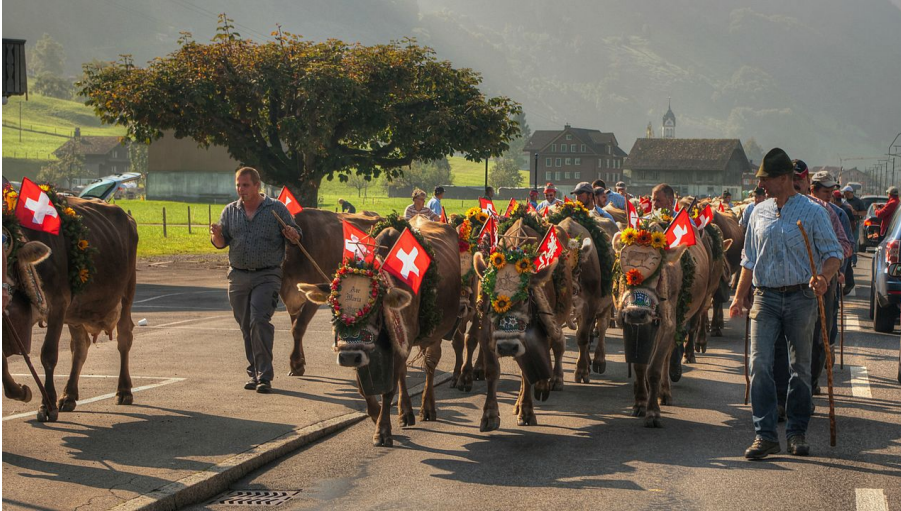
Brauchtum Alpabzug Wolfenschiessen