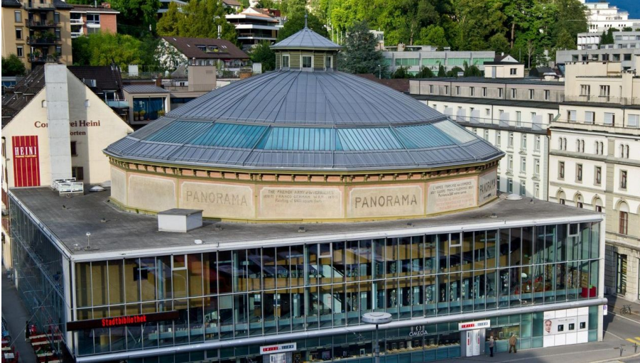
Bourbaki Panorama