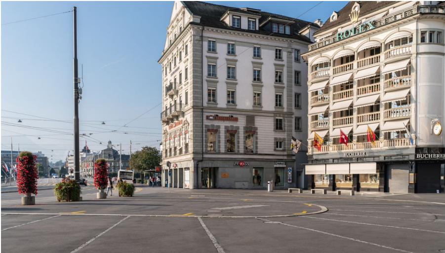
Bucherer Juwelier Luzern