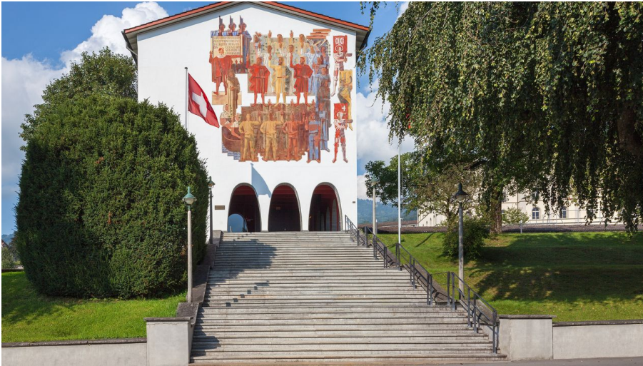
Bundesbriefmuseum Schwyz - - info@wiegederschweiz.ch