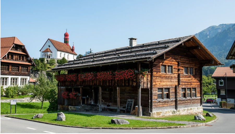
Geburtshaus Bruder Kalus und Kapelle Boromäus Flüeli-Ranft