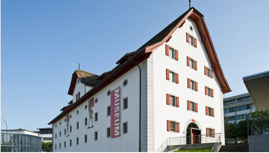
Forum Schweizer Geschichte Schwyz