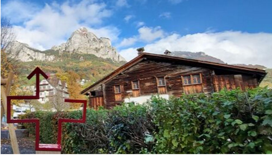
Fotospot Wiege der Schweiz Schwyz