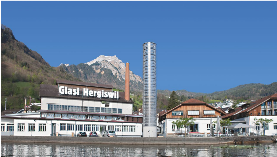
glasi_vom_see_a.tif - © Nidwalden Tourismus