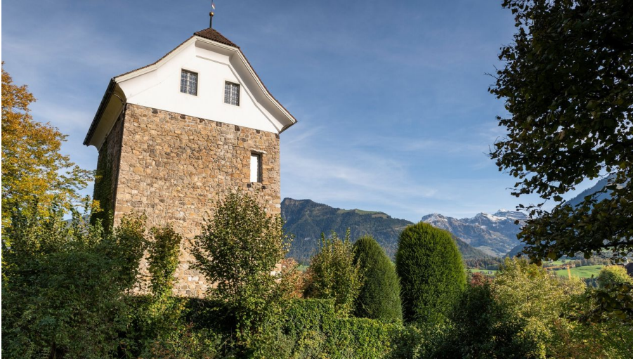
Hexenturm in Sarnen