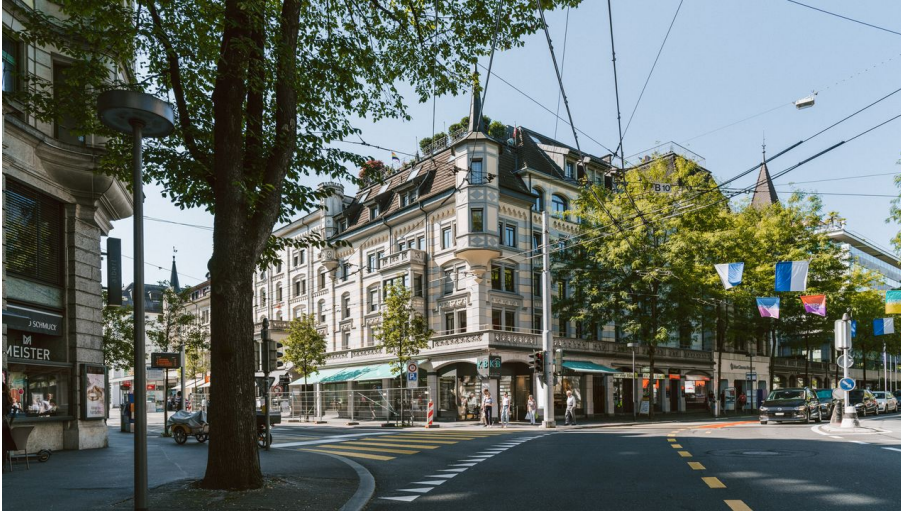
Viktoriaplatz - © Luzern Tourismus, Laila Bosco