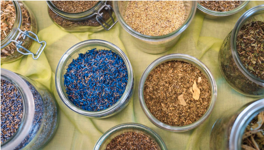
Chrütlimacher .jpg - © UNESCO Biosphäre Entlebuch / Laila Bosco, laila_bosco