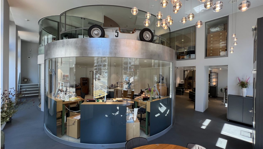
House of Chronoswiss