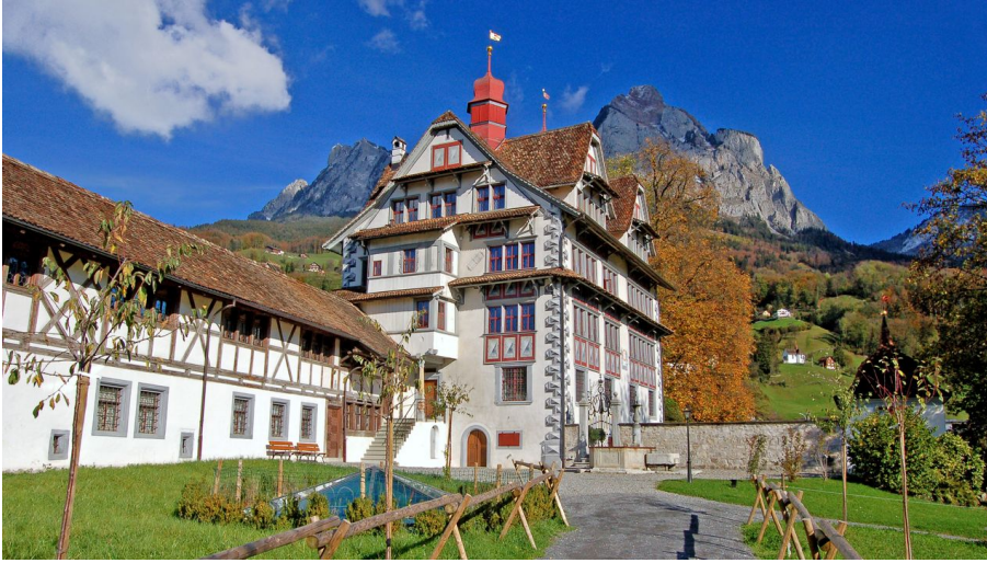
Ital Reding-Haus in Schwyz.JPG