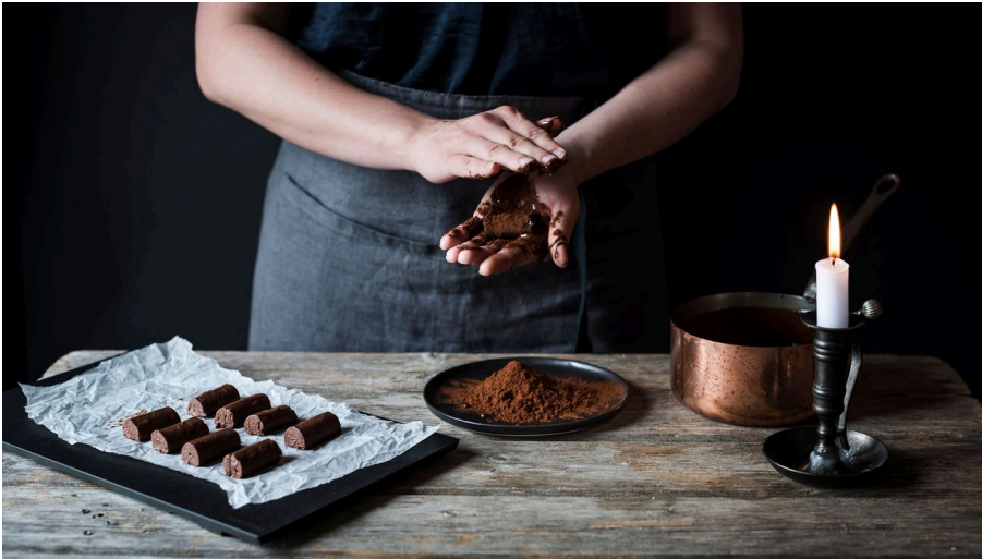
MaxChocolatier Creation