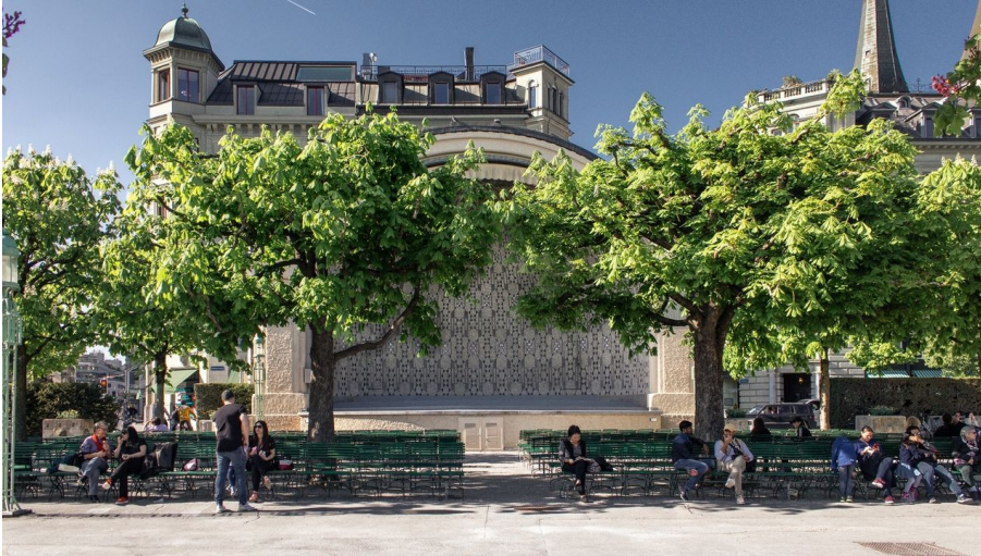
Musikpavillon beim Kurplatz Luzern