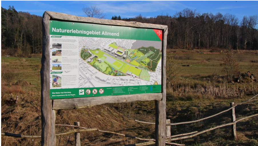
Naturerholungsgebiet Allmend