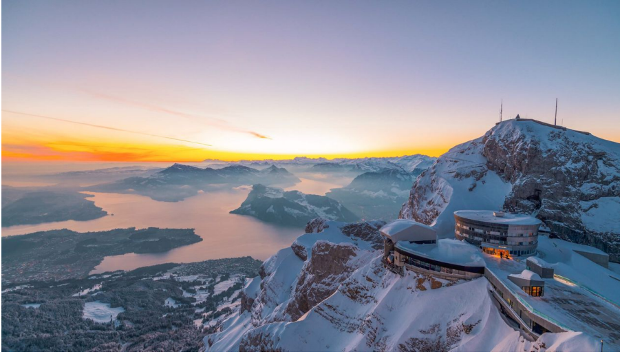
Pilatus Sonnenaufgang