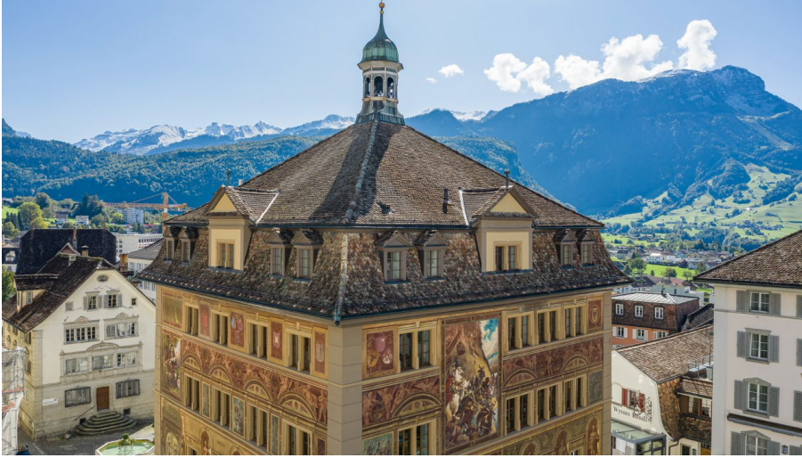
Rathaus Schwyz