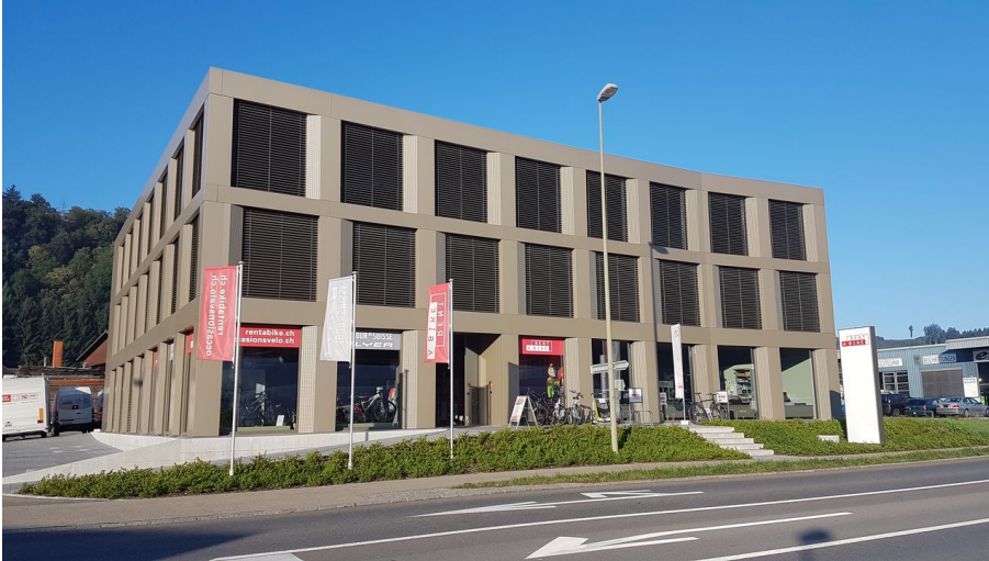
Rent a Bike Willisau