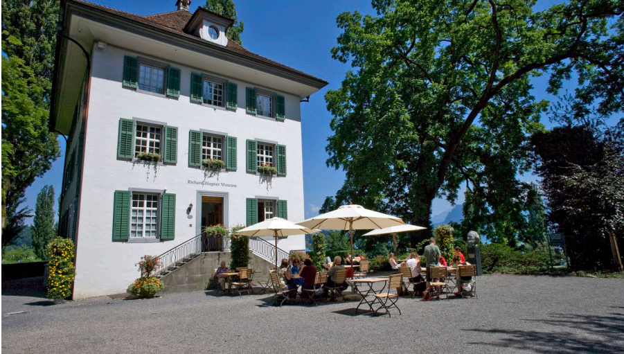
Richard Wagner Museum