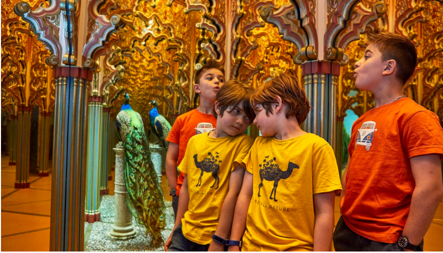
Spiegellabyrinth Alhambra