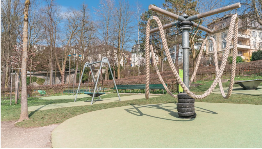
Spielplatz Alter Friedhof, Luzern