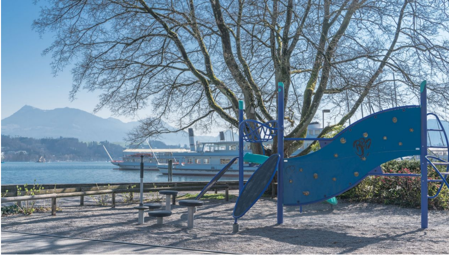
Spielplatz Inseli, Luzern