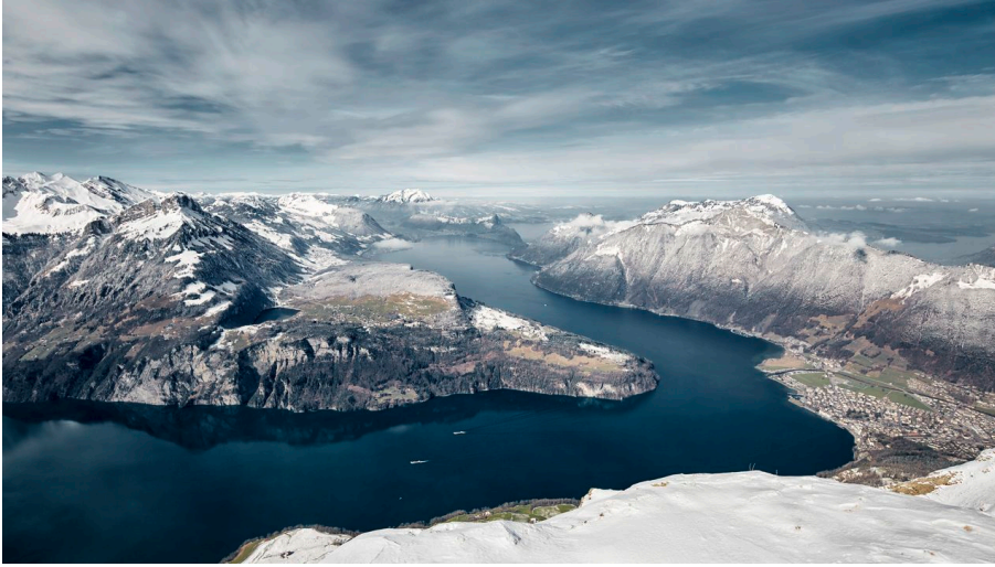
Stoos-Fronalpstock Winter