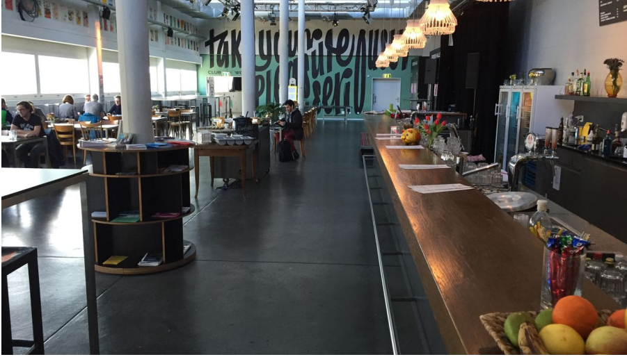
Südpol Luzern