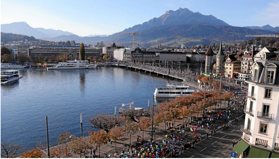
SwissCityMarathon Lucerne