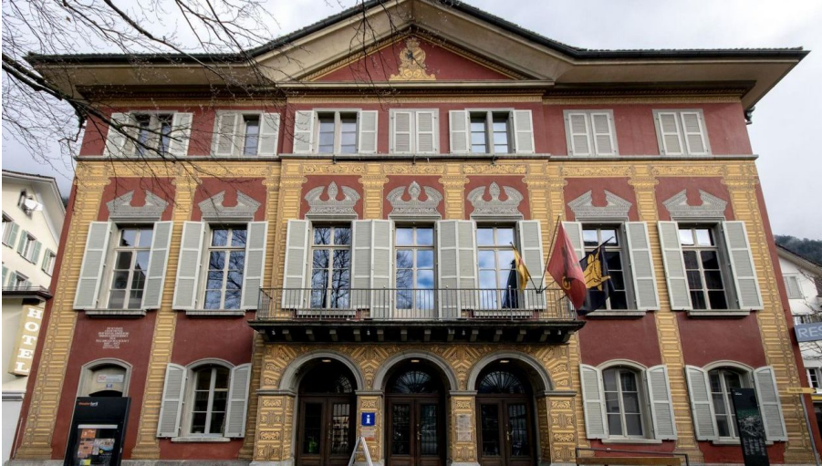
Theater Uri