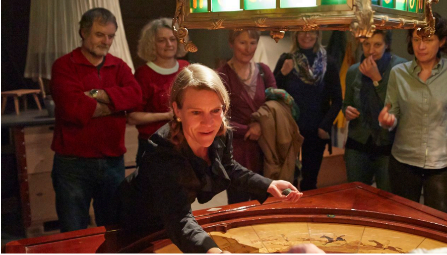
Theatertour im historischen Museum.jpg