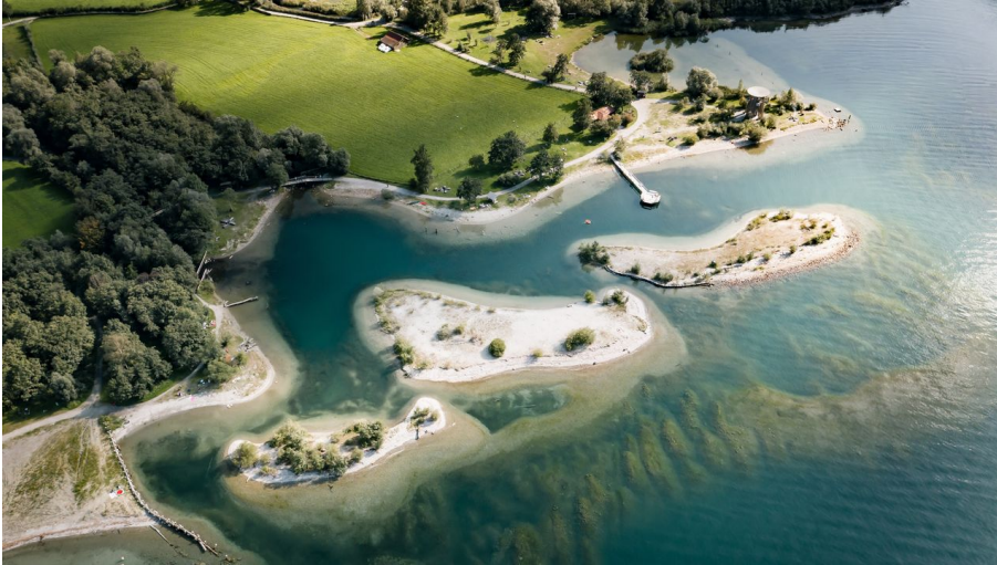
Naturschutzgebiet Reussdelta