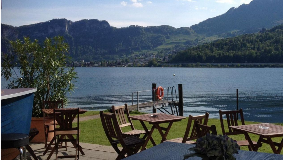
Winkelbadi Horw