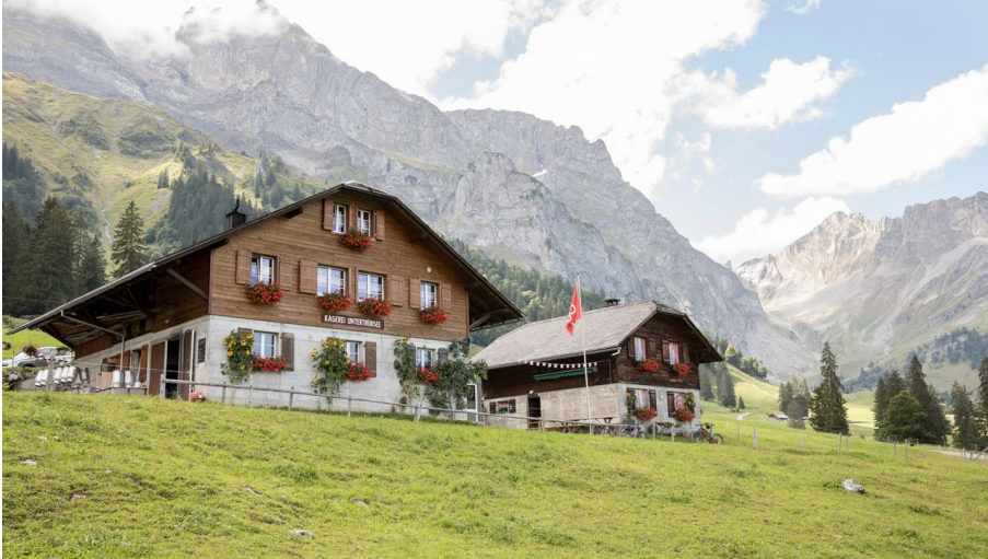
Engelberg - Titlis Tourismus, Engelberg-Titlis Tourismus