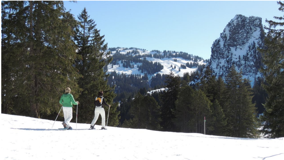
Schneeschuhläufer, im Hintergrund der Grosse Schijen