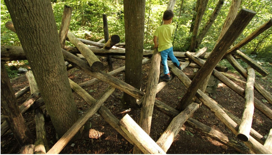
Ameisiwäg Schwyz - Spielplatz bei der Feuerstelle