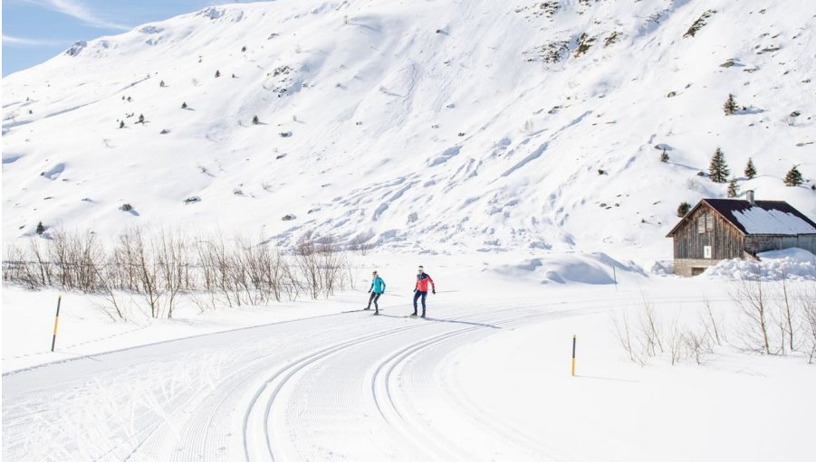
Andermatt-Urserntal Tourismus GmbH, Ferienregion Andermatt