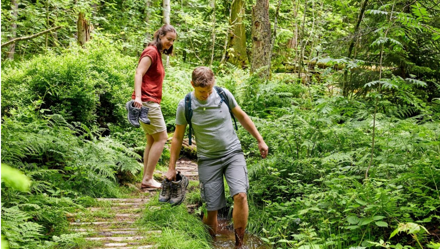
Barfusspfad (Gesundheitspfad) Heiligkreuz - © Beat Brechbühl, UNESCO Biosphäre Entlebuch