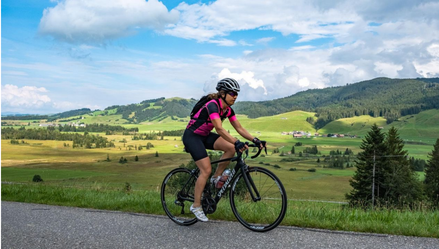
Xaver Büeler, Schwyz Tourismus