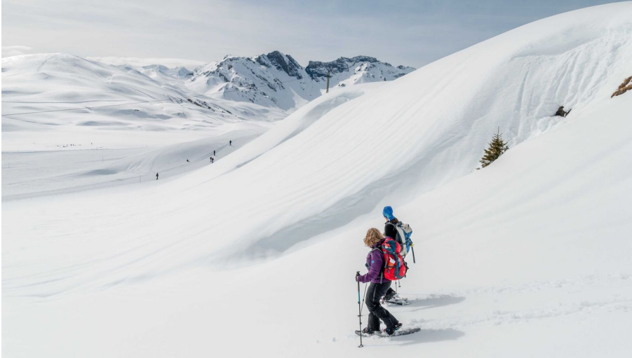
Schneeschuhtour Bonistock