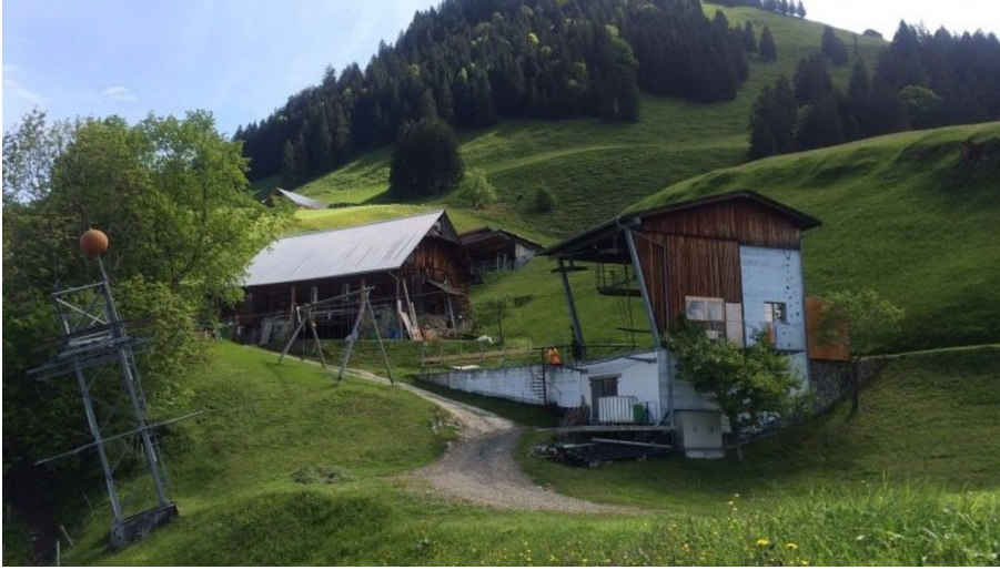
Urs Lang, Region Luzern-Vierwaldstättersee