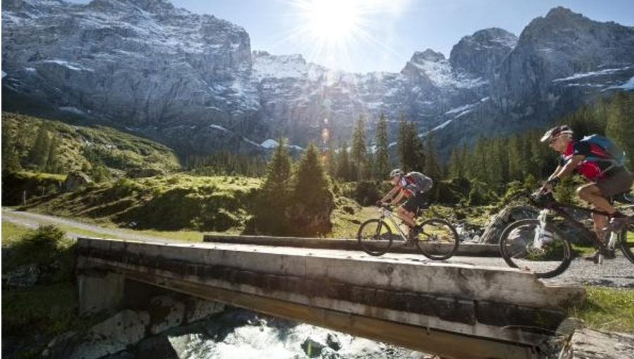
Brunnital-Bike-Tour: Biken unter der Ruchen-Nordwand - ein besonderes Erlebnis!