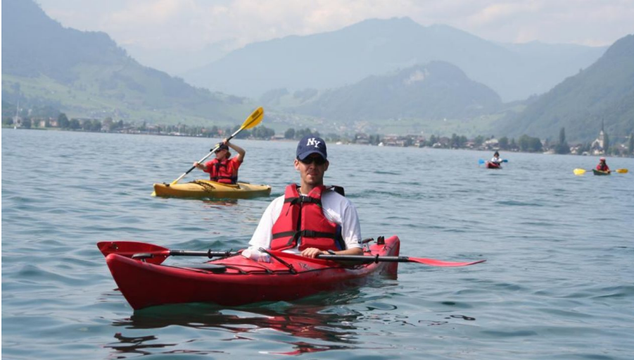
Kanuroute Buochs-Rotschuo