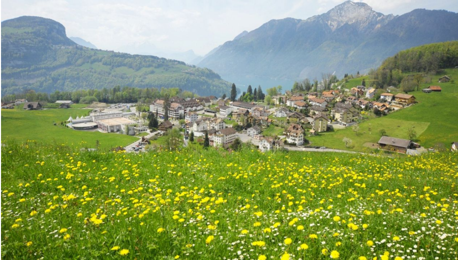
Stoos-Muotatal Tourismus, Stoos-Muotatal Tourismus GmbH