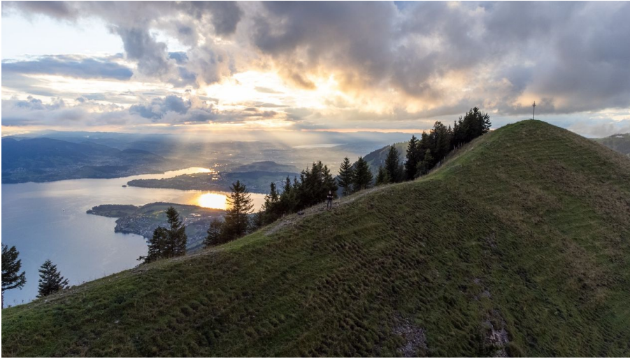
Sonnenuntergang auf dem Rigi Dossen