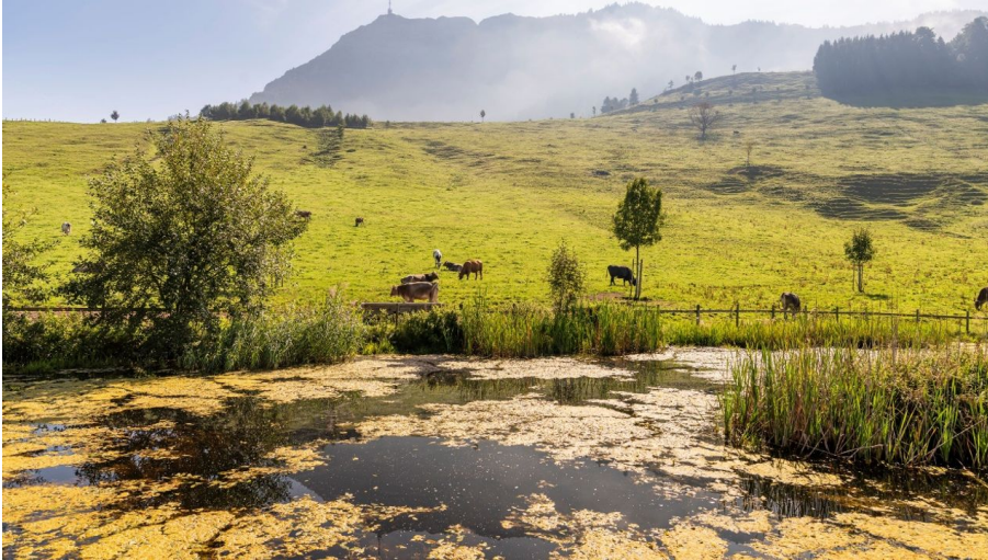
Rita Baggenstos, Schwyzer Wanderwege