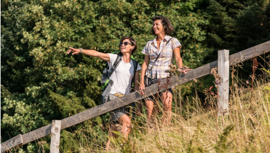
Steiler Anstieg mit traumhafter Aussicht