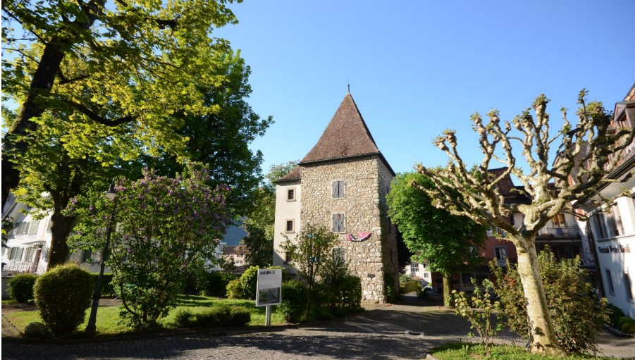
Erlebnisregion Mythen, Erlebnisregion Mythen